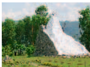
Una réplica del Monte de la Cola del Pez نموذج لجبل ذيل السمكة

una boda, a la cual los familiares de los desposados nos permitieron –excepcionalmente– asistir y tomar fotos, hasta que se hartó el novio de flashes y del bullicio y nos ordenó que nos fuéramos... Nos fuimos sonriendo, después de haber aprovechado la ocasión de fotografiar a los novios en el momento del acta de matrimonio.