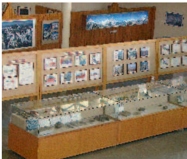
Vista parcial de las exposiciones del Museo Internacional de Montañas جانب من معروضات متحف الجبال