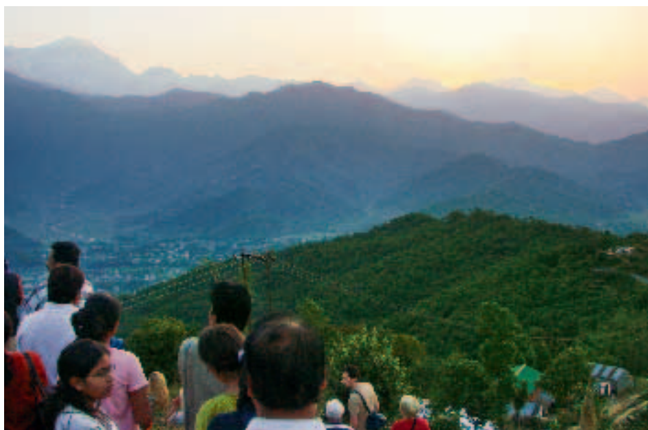
Cumbres del Himalaya a la puesta del sol

El museo incluye una biblioteca especializada en todos los temas relacionados con la montaña y el alpinismo, y una gran sala diseñada interiormente en forma de templo tibetano. Por cierto, pudimos contemplar un templo tibetano cuando visitamos 'la aldea china', en la que viven los refugiados tibetanos llegados aquí los años 60 del siglo pasado, como consecuencia de las divergencias entre el jefe del país, el Dalai Lama, personaje sagrado en el Tibet, y el Gobierno chino de esa época. La aldea es sencilla, con casas pequeñas y en su centro un templo chino. Una foto presenta alfombras y estatuas magníficas, con la foto del Dalai Lama en primer plano.