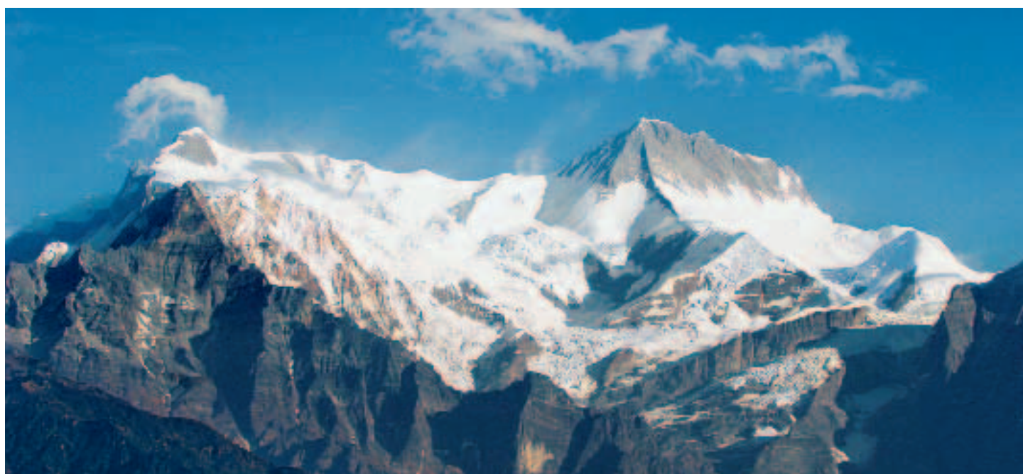
Picos del Himalaya cerca de Pokhara

Pokhara es, ciertamente, una perla del turismo nepalés, que ha sido la última etapa de una gira extraordinaria..., mi gira por tierras nepalesas, por el reino de las montañas y de la belleza. ■