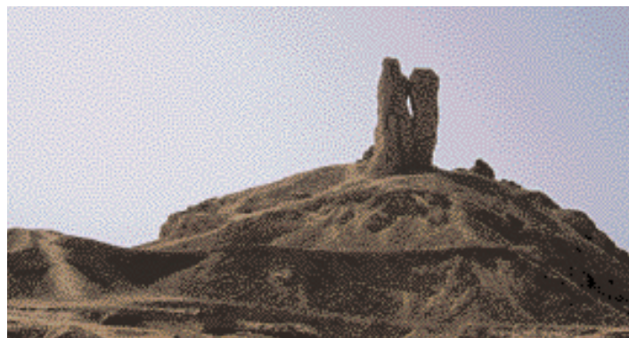
Restos del Palacio de Nemrod y la torre en la que se puso la catapulta بقايا قصر النمرود والبرج الذي وضع فيه المنجنيق

Este lugar sagrado y sus alrededores necesitan una atención más importante, que corresponda a su carácter sagrado y a la importancia histórica de la 'zaqura', del horno, del padre de los Profetas, el Enviado de Dios, Abraham, que la paz del Señor lo acompañe. ■