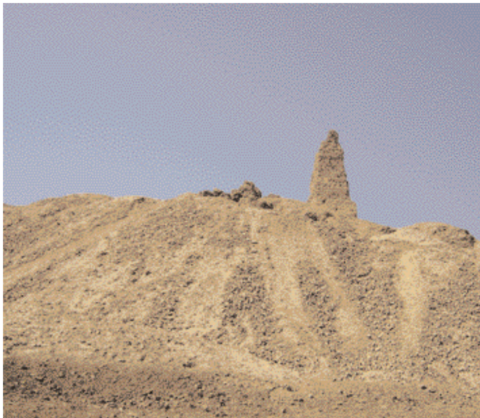
Restos del Palacio de Nemrod

Al final de esta escalera, a la izquierda, está el lugar donde nació el padre de todos los enviados de Dios. Allí está la roca sobre la cual lo puso su madre cuando nació. Es una roca de color amarillento, con dos cavidades pequeñas llenas de agua. Antaño salía un olor agradable ▶