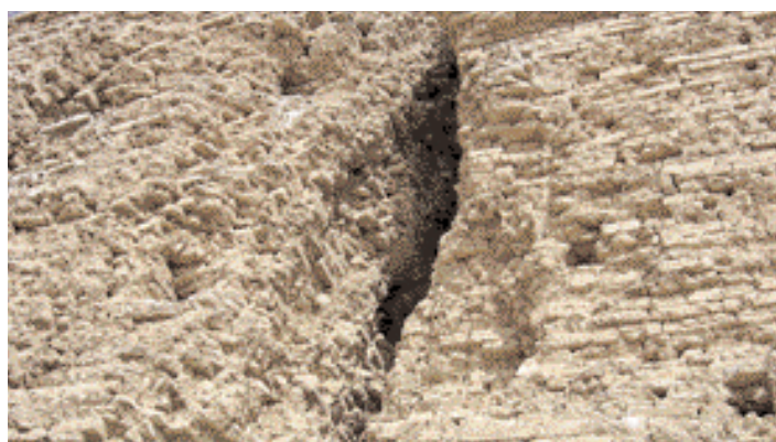
Restos del Palacio de Nemrod