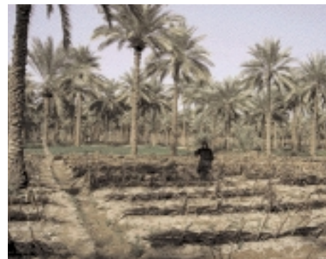
Zona rural cerca del horno المنطقة القريبة من المحرق

Originalmente, el lugar era una gran excavación, que fue tapada con troncos y madera reunidos por todos los habitantes del reino. Se ha dicho que las mujeres vendían sus gacelas para comprar troncos. Sin embargo, por los 4.000 años transcurridos y por la acción de la naturaleza, el gran agujero ha