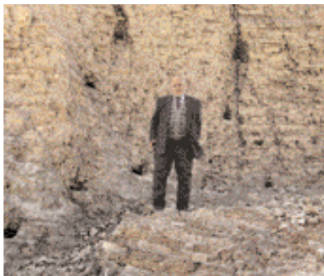
Restos del Palacio de Nemrod الكاتب في قصر النمرود

años. Tanto insistía para que su madre lo sacara de aquella cueva que lo hizo a regañadientes. Los historiadores indican que eso ocurrió aproximadamente el siglo 19 antes de Cristo, siendo unos 567 años los que separan la época de Abraham de la de Moisés.