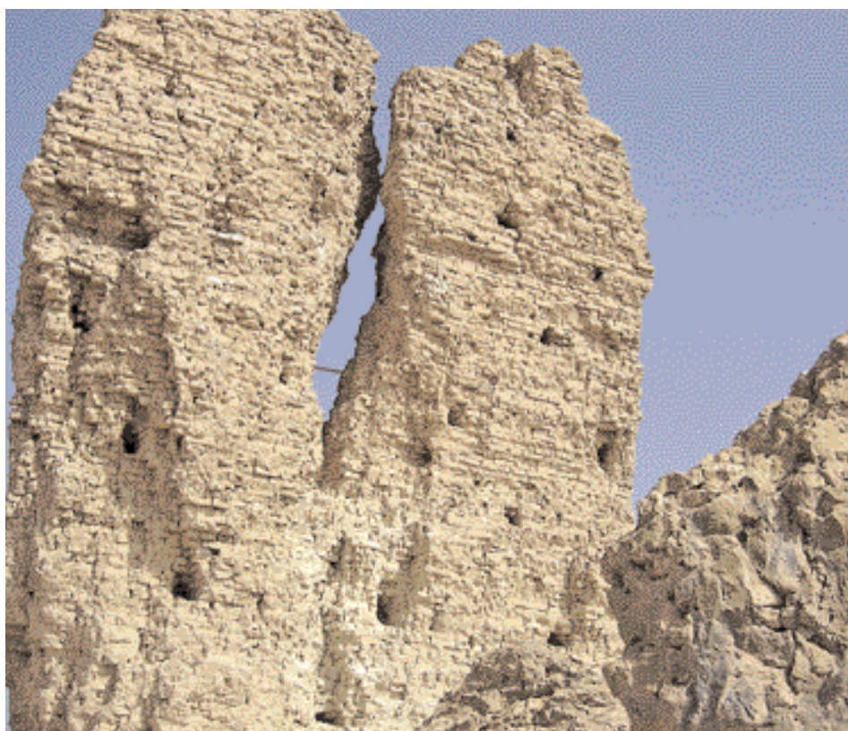
Restos del Palacio de Nemrod