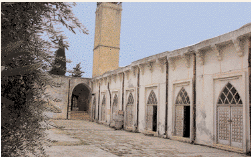
La Gran Mezquita de Sarmin

"Idlib es un trozo de paraíso y una selva riquísima": es lo que dijeron los descubridores franceses. Se trata de una provincia siria situada en la parte noroeste del país, lindando con Turquía al norte, con Alepo al este, con Hamah al sur y con Latakia al oeste