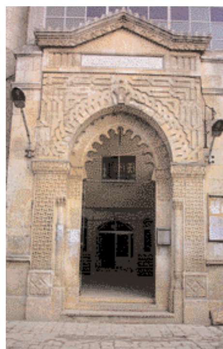
Puerta de la Gran Mezquita de Takharim

Idlib la verde respira amor hacia todo aquel que viene a visitarla, con una invitación permanente para todo aquel a quien le interese el beneficio y el placer. ■