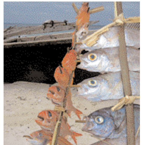
El pescado es una alimentación popular الأسماك غذاء شعبي

Para más información o para efectuar donaciones, se puede escribir al Director del Proyecto (Project Manager), en Misali: Island Conservation and Development Project. P. O. box 283, Wete, Pemba, Tanzania.