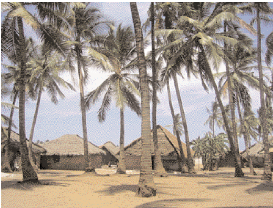
Aldea de Pemban

Con financiación de la Fundación McArthur, la ▶