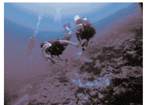
El muro Murray