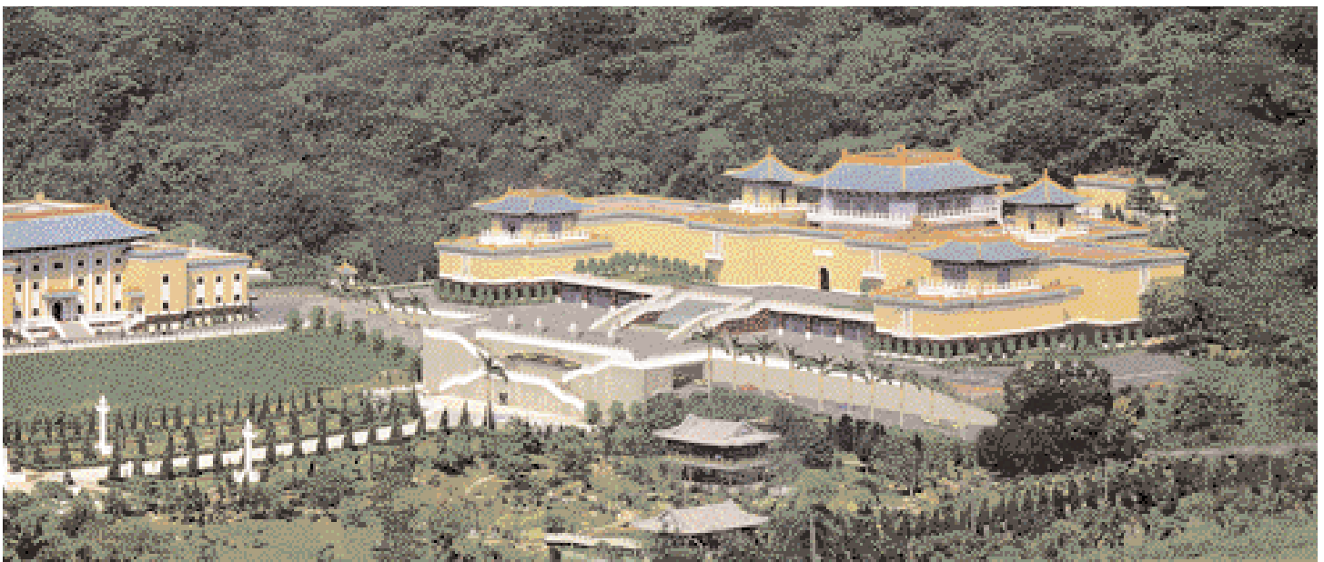
Museo del Palacio Nacional

El emplazamiento principal del festival de las linternas tenía lugar en la memorable plaza ▶