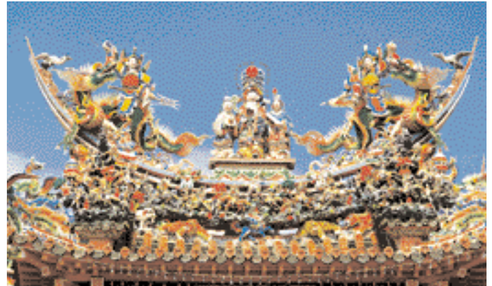
Grabados en lo alto de un templo