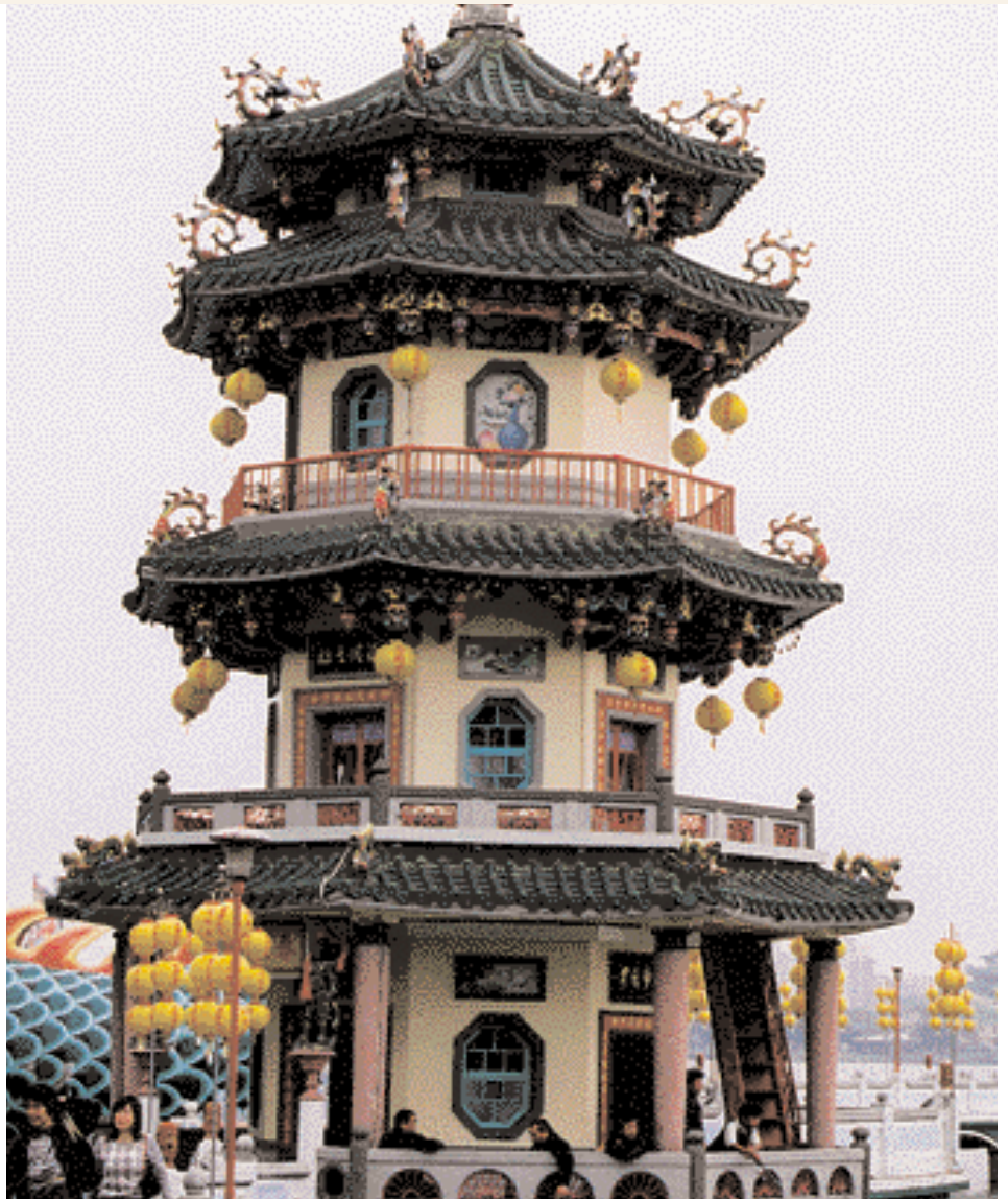
Pagoda en sur taiwanés

La señora tenía razón también en sus "otras" recomendaciones. El sushi es exquisito, tanto como en Tokio, y la carne asada mongol también lo es, en particular en el segundo piso ▶