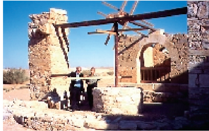
Qasr 'Amra Brunnen قصر عمرة-بئر القصر

Nachdem wir unserem erfreuten Führer ein paar U.S. Dollar in seine Hand gedrückt hatten, erklärte er uns den Weg zur Qasr 'Amra, dem Vergnügungspalast der Omajjaden. Wir fuhren auf dem südlichen Ring der Autobahn zwischen Amman und