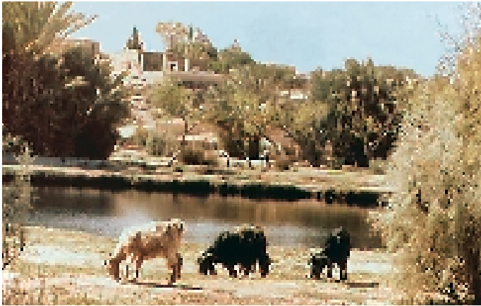
Al-Azraq Oase واحة الزرقاء

Omajaden und ihre Hinterlassenschaften schienen bei ihnen offensichtlich auf kein großes Interesse zu stoßen. "Ich glaube, sie wollen zur Qasr al-Azraq, das ist ein paar Kilometer die Straße runter", erklärte uns ein anderer Passant, der zufällig das Gespräch mitbekommen hatte und zeigte uns die Richtung.