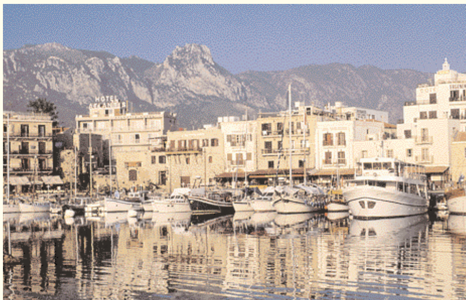
Puerto de Grine